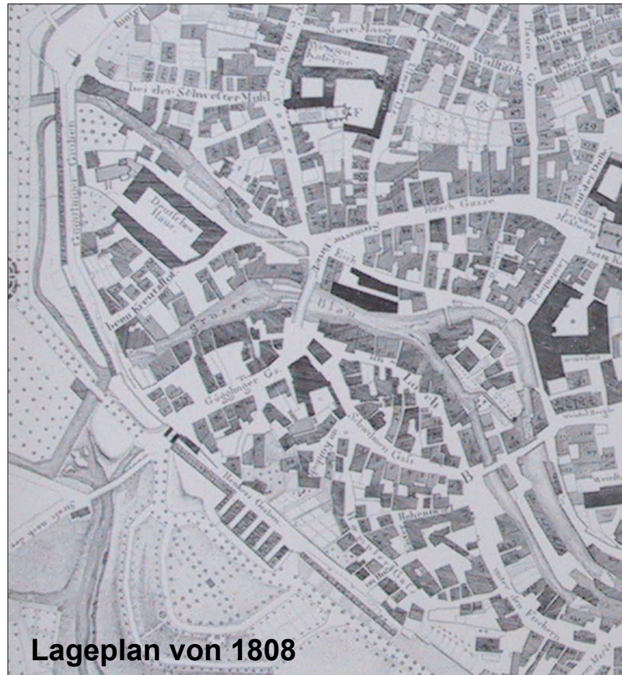
Lageplan von 1808