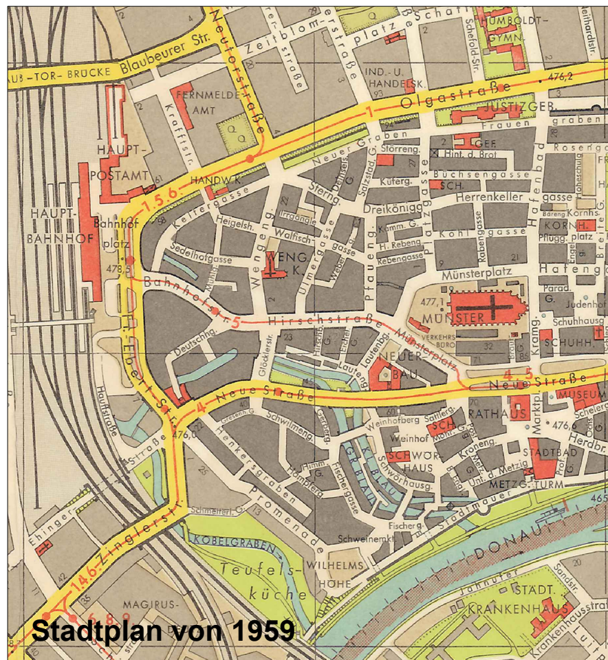
Stadtplan von 1959