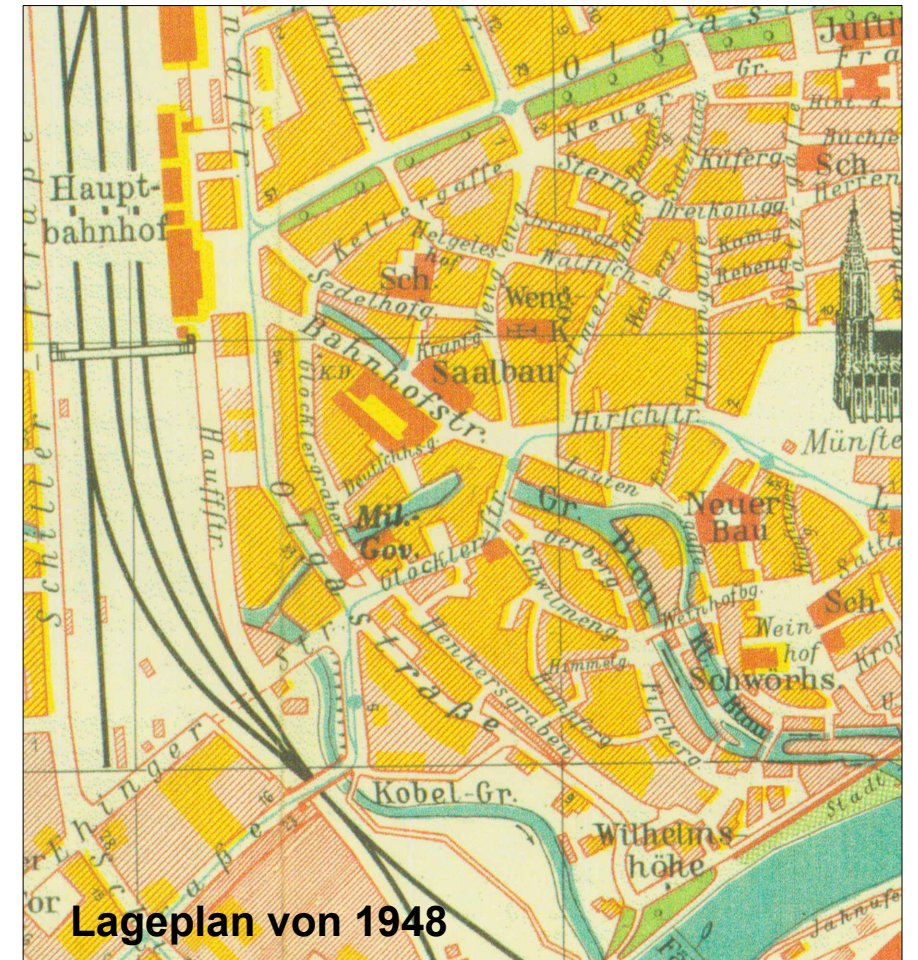
Lageplan von 1948