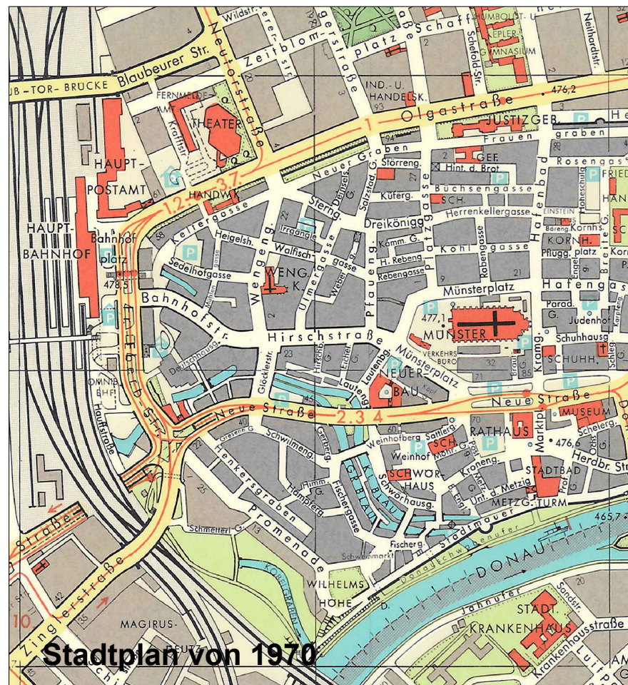
Stadtplan von 1970