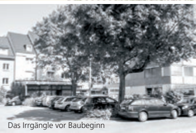
Das Irrgängele vor Baubeginn